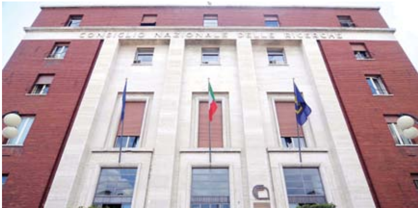
La sede del CNR

Un esempio di queste opportunità è rappresentato da Humanities and Heritage Italian Open Science Cloud (H2IOSC) , un progetto a guida CNR finanziato dal PNRR per un importo di oltre 41 milioni di euro. L'obiettivo? Consolidare, mettere in rete, allargare le strutture, gli impianti e la strumentazione a disposizione della comunità scientifica nei campi della ricerca umanistica e dell'analisi, preservazione e interpretazione del patrimonio culturale. In una parola, rafforzare le Infrastrutture di Ricerca. Massimizzandone l'impatto sulla società e la ricaduta economica sui territori, specialmente nel Mezzogiorno, attraverso l'assunzione di 80 giovani ricercatori e ricercatori, il potenziamento delle attività di formazione in col-