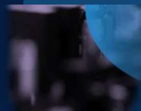
PHYSICAL SCIENCE & ENGINEERING